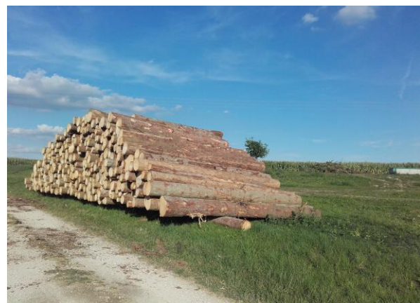
Vorübergehende Lagerung auf Förderflächen

Es werden zusätzliche Lagerplätze benötigt. Vor der Lagerung von Schadholz auf landwirtschaftlichen Förderflächen müssen Sie einen formlosen Antrag beim Amt für Ernährung, Landwirtschaft und Forsten Ingolstadt stellen. Die FBG Eichstätt unterstützt Sie bei der Antragsstellung.